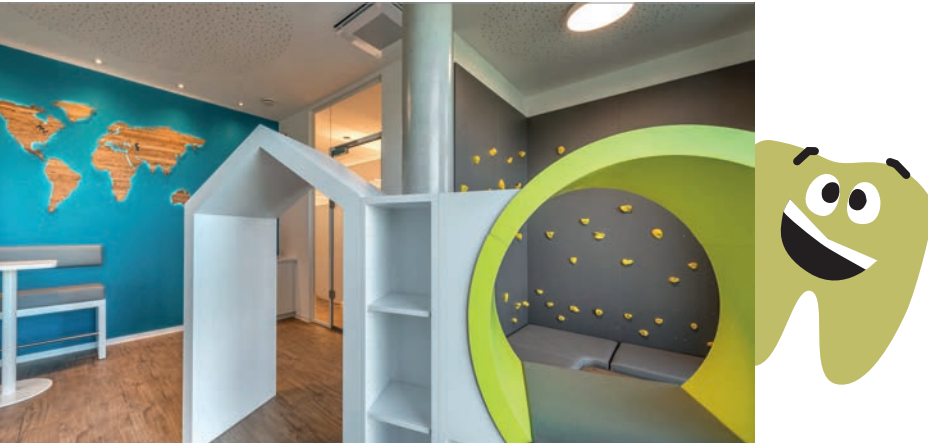
Abb. 2: Der Wartebereich ist nicht nur irgendein Wartebereich. Hier beginnt die Reise der kleinen Patienten um die Welt. Doch bevor das Abenteuer losgeht, bietet eine Spielecke genug Möglichkeiten zum Klettern und Austoben.

Gemeinsam mit dem Planungs- und Projektteam der mayer gmbh innenarchitektur + möbelmanufaktur wurde ein ganzheitliches und modernes Raumkonzept erarbeitet, bei dem der Besuch beim Zahnarzt, speziell für Kinder, zu einer Reise um die Welt wird. Immer im Gepäck mit dabei: eine große Portion „lachen“.