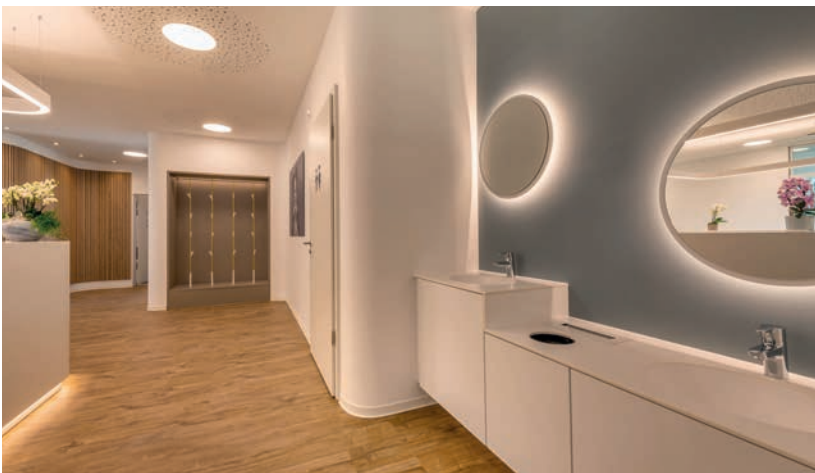
Abb. 3: Sowohl die Garderobe als auch die Mundhygiene sind für jeden Patienten problemlos zu erreichen, sodass sich auch die Kleinsten ganz selbstständig und groß fühlen können.

Bei der Konzeption wurde der Fokus ganz besonders auf den Blickwinkel des Kindes gelegt. So finden sich überall Gimmicks, wie z.B. das kindgerechte Zahnputzbecken oder ein Aufstieg am Empfangsbereich. Dadurch wird den Kleinsten bereits beim Zutritt in die Praxis die Barriere genommen und sie werden vollumfänglich in die Abläufe integriert.